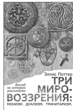
Эллис Поттер «Три мировоззрения» Мирт, 2012

С другой стороны, если нет никакого абсолюта, мы свободны. Мы можем решать на свой счет все, что нам хочется, и смысл всего существующего – это не что иное, как наша реакция на него. Ясно, что такая мысль очень привлекательна, и, кроме того, она означает, что можно прекратить задавать вопросы.